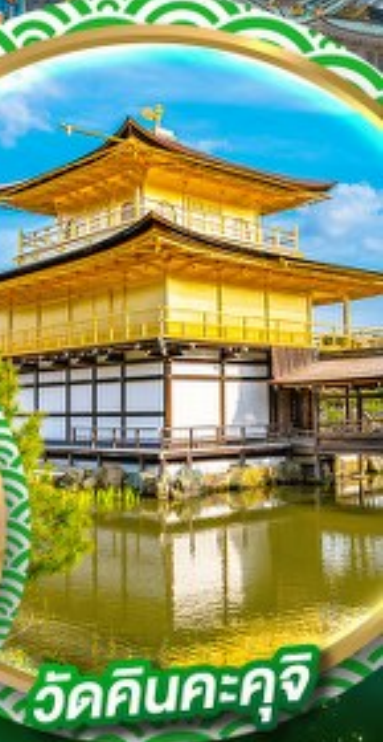
วัดคินคะคุจิ