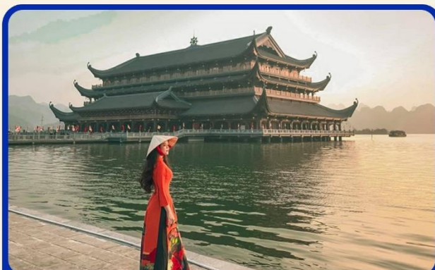
จุดเชคอินแห่งใหม่ “วัดตามจึก”