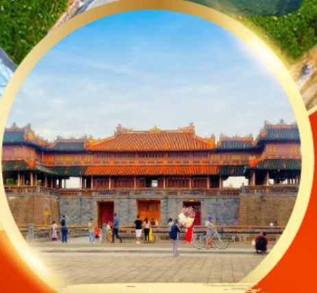
พระราชวังโบราณไดโนย

เมนูพิเศษ ! กุ้งมังกรซอสเนย + หม้อไฟทะเล SEAFOOD 1 มื้อ, บิงย่าง ซาบู 1 มื้อ