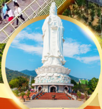
วัดหลังอั้ง