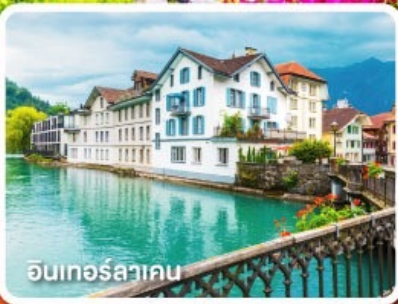
อินเทอร์ลาเคน