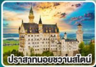
ปราสาทนอยชวานสไตน์