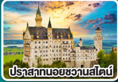
ปราสาทนอยชวานสไตน์