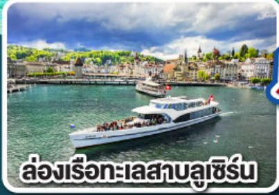
ล่องเรือทะเลสาบลูเซิร์น

เที่ยวครบเส้นทาง Jewels of Romantic Europe ของบาวาเรียและทีโรล