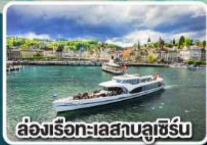
ล่องเรือทะเลสาบลูซิิร์น

เที่ยวครบเส้นทาง Jewels of Romantic Europe ของบาวาเรียและทีโรล