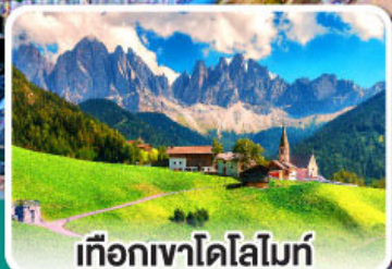
เทือกเขาโดโลไมท์