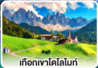
เทือกเขาโดโลไมท์