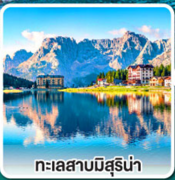
ทะเลสาบมิสุรีน่า

เข้าชมมหาวิหารเซนต์ปีเตอร์ ที่ใหญ่ที่สุดในโลกแห่งนครวาติกัน