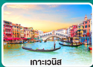
เกาะเวนิส