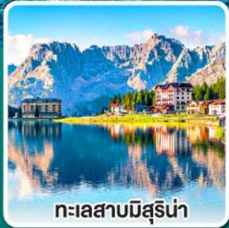
ทะเลสาบมิสุรีน่า

เข้าชมมหาวิหารเซนต์ปีเตอร์ ที่ใหญ่ที่สุดในโลกแห่งนครวาติกัน