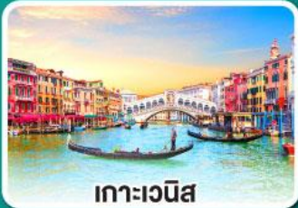
เกาะเวนิส