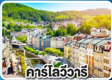
คาร์ลสไบร์