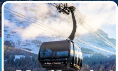
กระเช้า ไอเกอร์เอ็กเพรส สู่อยอดเขาจุงเฟรา

อิตาลี สวิตเซอร์แลนด์ ฝรั่งเศส 10 วัน 7 คืน