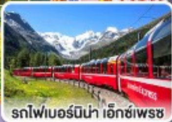
รถไฟเบอร์นีนา เอ็กซ์เพรส