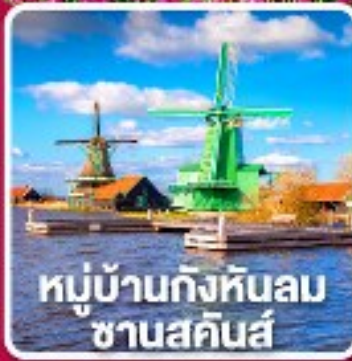
หมู่บ้านกังหันลม ซานสคินส์

เข้าชมเทศกาล สวนดอกไม้เคอเคนฮอฟ 1 ปีมีครั้งเดียว