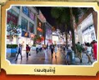
ถนนซินหนิง