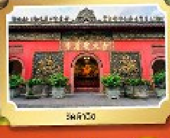
เสวียนโกว