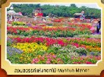
สวนสวรรค์ดอกไม้สีฤดู (Autumn Mirror)