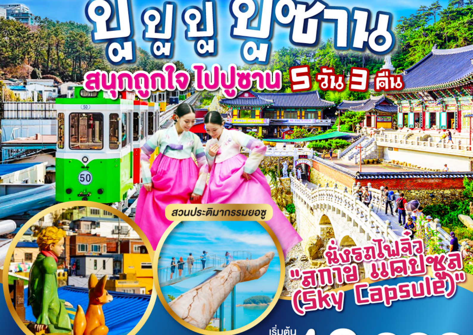
สวนประติมากรรมยอซู