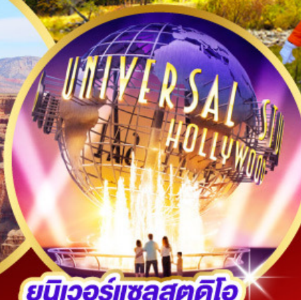
ยูนิเวอร์แซลสตูดิโอ