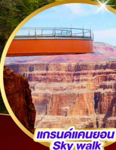
แกรนด์แคนยอน Sky walk