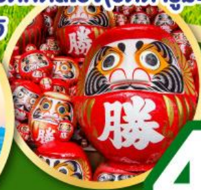
วัดคิตสึโอจิ (วัดदारุมะ)