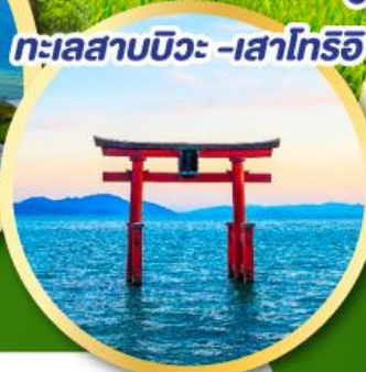
ทะเลสาบบิวะ - เสาโทริอิ