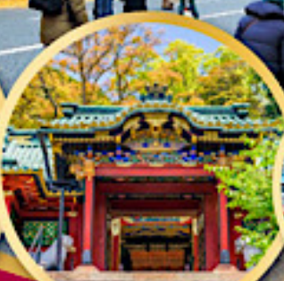
ศาลเจ้าโทโชคุ