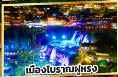
เมืองโบราณฟูหรง