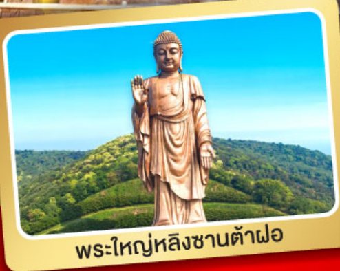
พระใหญ่หลังซานต้าฝอ