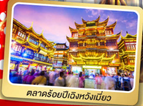
ตลาดร้อยปีเจิ้งหวงเมี่ยว