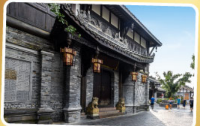
ถนนควานโจ๋เซียงจื่อ