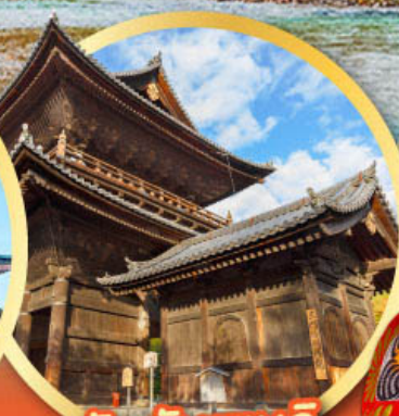
วัดนันเซนจิ