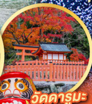
วัดดารุมะ