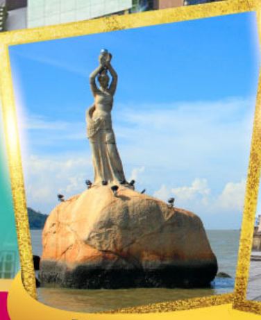
จูไห่ฟิชเชอร์เกิร์ล