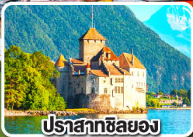
ปราสาทซิลยง