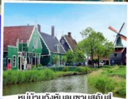
หมู่บ้านกังหันลมซานสคินส์