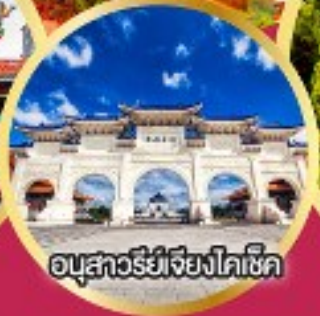
อนุสาวรีย์เจียงไคเช็ค