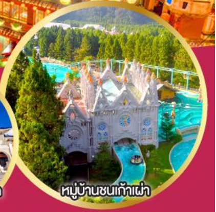
หมู่บ้านชนก้าเผ่า