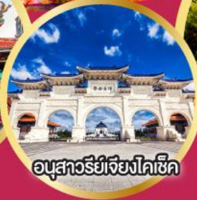
อนุสาวรีย์เจียงไคเช็ค