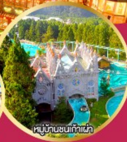
หมู่บ้านชนเก้าเผ่า