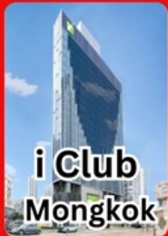
i Club Mongkok

คอนเฟิร์มเดินทาง พ.ย.67 1-3 / 8-10 / 15-17 / 22-24 พัก 4 ดาวย่านช้อปปิ้ง i CLUB MONGKOK