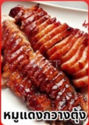
หมูแดงกวางตุ้ง