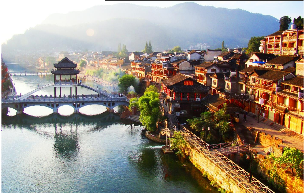
ภาพถ่ายจากสะพาน Fenghuang Bridge ยามเช้าตอนพระอาทิตย์ขึ้น

รับประทานอาหารเย็นที่ภัตตาคาร อาหารพื้นเมืองเผ่าแม้ว