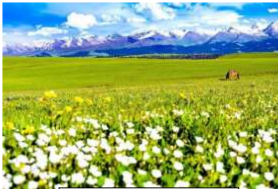
Flower Terrace

นำชมชมทุ่งหญ้าคาลาจัน Kalajun Grassland 喀拉峻草原 เป็น 1 ใน 6 ทุ่งหญ้าที่มีชื่อเสียงที่สุดในซินเจียง ซึ่งตั้งอยู่บนเส้นทางสายเหนือ ของเส้นทางสายไหม มีพื้นที่ทั้งหมด 2,848 ตารางกิโลเมตร อากาศเย็นและดินอุดมสมบูรณ์ จึงเป็นทุ่งหญ้าที่มีคุณภาพสูง จุดชมวิวได้แก่ ระเบียงดอกไม้ Flower Terrace แกรนด์แคนยอนปากออร์โต ระนาบตรีโพลาาร์ ระเบียงเหยี่ยว Falcon Terrace ทุ่งหญ้ากว้างใหญ่สวยงาม มีเนินเขาสลัซซันชันเป็นลูกคลื่น มีภูเขาสูงตระหง่านปกคลุมด้วยหิมะเป็นฉากหลัง จึงเป็นทิวทัศน์ที่ยอดเยี่ยมสำหรับท่องเที่ยวและถ่ายภาพ ในภาษาคาซัค "Kalajun" หมายถึงทุ่งหญ้า "Kala" แปลได้ว่า มีด อุดมสมบูรณ์ และกว้าง อักษร "Jun" หมายถึงความหนาแน่น (รวมกรณี จุดชมวิว lieyingtai)