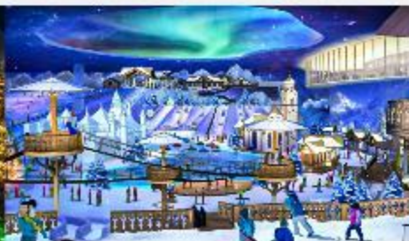
ICE AND SNOW WORLD