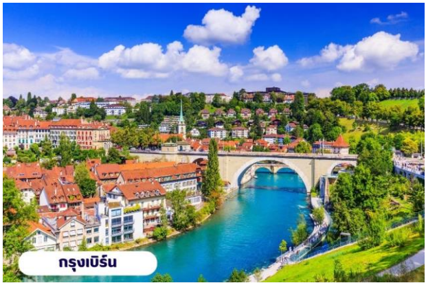
กรุงเบิร์น

☉ บริการอาหารเช้า ณ ห้องอาหารของโรงแรม จากนั้นนำท่านเที่ยวชมสถานที่สำคัญต่างๆในกรุงเบิร์น กรุงเบิร์นได้รับการยกย่องจากองค์การยูเนสโกให้เป็นเมืองมรดกโลก ในปี ค.ศ. 1863 นอกจากนี้เบิร์น ยังถูกจัดอันดับอยู่ใน 1 ใน 10 ของเมืองที่มีคุณภาพชีวิตที่ดีที่สุดในโลกในปี ค.ศ. 2010 นำท่านชม บ่อหมีสีน้ำตาล สัตว์ที่เป็นสัญลักษณ์ของกรุงเบิร์น นำท่านชม มาร์กาสเซ ย่านเมืองเก่า ปัจจุบันเต็มไปด้วยร้านดอกไม้และบูติก เป็นย่านที่ปลอดภัย จึงเหมาะกับการเดินเที่ยวชมอาคารเก่า อายุ 200-300 ปี นำท่านลัดเลาะชม ถนนจุงเคอร์นกาสเซ ถนนที่มีระดับสูงสุดของเมืองนี้ ซึ่งเต็มไปด้วยร้านภาพวาดและร้านขายของเก่าในอาคารโบราณ ชม นาฬิกาใช้ทศลือคเค่นทรม อายุ 800 ปี ที่มีโชว์ให้ดูทุกๆชั่วโมงในการตีบอกเวลาแต่ละครั้ง หอนาฬิกานี้ ในช่วงปี ค.ศ. 1191-1256 ใช้เป็นประตูเมืองแห่งแรก ภายหลังได้ดัดแปลงใช้ทศลือคเค่นทรมให้กลายเป็นหอนาฬิกา พร้อมติดตั้งนาฬิกาดาราศาสตร์เข้าไป จากนั้นอิสระให้ท่านเดินเล่นและเก็บภาพตามอัยาศัยหรือจะเลือกช้อปปิ้งซื้อสินค้าแบรนด์เนมและซื้อของที่ระลึก