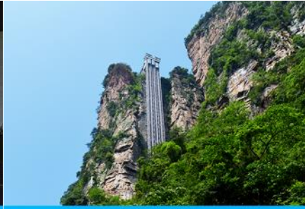
ลิฟท์แก้วไปหลาง