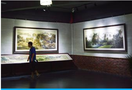
พิพิธภัณฑ์ภาพหินทราย