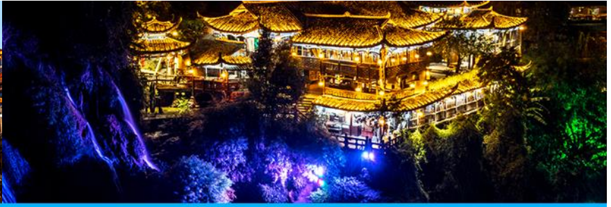
เมืองโบราณฟูหรงเจิน

วันที่สาม เมืองจางเจียเจีย-ตึกมหัศจรรย์ 72 ชั้น-นอนในเมืองเก่าโบราณฟูหรงเจิน-เต็มอิ่มแสงสี ยามค่ำกิน ออฟชั่นไกด์ขายโปรแกรม เขาเทียนเหมินซาน กระเช้าขึ้นลง ประตูลูสุวรรค์ บันไดเลื่อนทะเลภูเขา