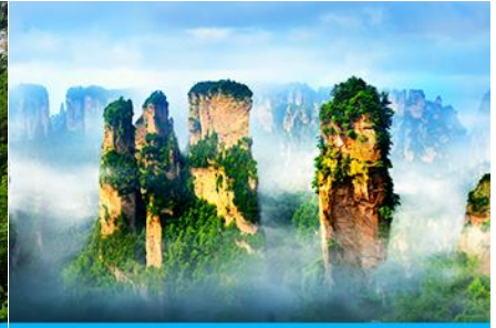
ภูเขาอวตาร

วันที่สี่ เมืองโบราณฝูหรงเจิ้น –จางเจียเจี๋ย –พิพิธภัณฑ์ภาพหินทราย-ขึ้นลิฟท์แก้ว เทียนเขาเทียนจื่อซาน (เขาอวตาร) คี้นั้นนอนบนเขา ฝ่งหยวนเจียเจี๋ย