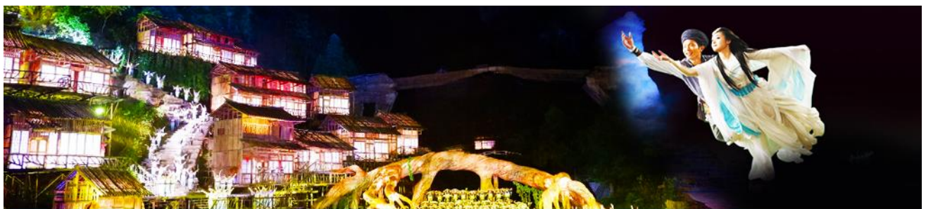
The Love Story of a Wooden Man and Fairy fox

** บันไดเลื่อนทะลุภูเขาจะปิดให้บริการในช่วงเดือนธันวาคม - เดือนกุมภาพันธ์ ของทุกปี. ด้วยเหตุผลด้านความปลอดภัย เนื่องจากเป็นช่วงที่มีหิมะปกคลุมในบางจุด และเส้นทางซึ่งทำให้ไม่สามารถใช้สัญจรได้ ในส่วนที่เป็นกระเช้าขึ้น/ลงเขายังคงเปิดให้บริการตามปกติในฤดูหนาว**