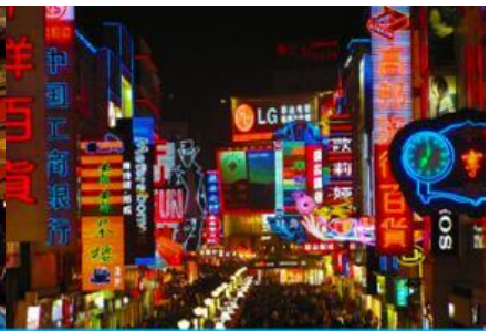
ถนนคนเดินซุนซีลู่

วันที่ห้า เมืองเม่าเซียน – ตุ๊กตาหมีนอนเซลฟี – ถนนไท่กู่หลี่ – วัดต้าฉือ - ซอปปิงถนนซุนซีลู่