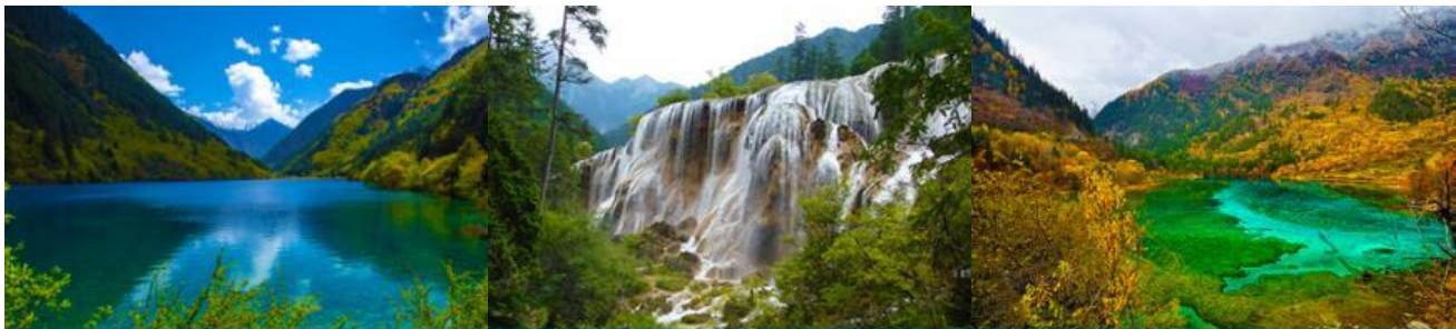
ทะเลสาบแรด (RHINO LAKE)

หลังอาหารเช้านำท่านเดินทางสู่ อุทยานแห่งชาติจิวจ้ายโกว 九寨沟景区 ตั้งอยู่ด้านทิศเหนือของมณฑลเสฉวน ซึ่งเป็นส่วนหนึ่งในบริเวณตอนใต้ของเทือกเขาหิมชาน ห่างออกไปจากตัวเมืองเฉิงตูราว 500 กิโลเมตร จิวจ้ายโกวมีชื่อเสียงด้านความงามแห่งสีสันที่แปลกเปลี่ยนไม่รู้จบ ทะเลสาบผุดขึ้นท่ามกลางหมอกเมฆไม้เขียวขจี น้ำใสเป็นประกายชุ่มฉ่ำ ยอดเขาหิมะตัดกับท้องฟ้าสีคราม เกิดเป็นภาพธรรมชาติอันงดงามที่แปรเปลี่ยนไปตามฤดูกาลผล ด้วยความสวยงามจึงทำให้อุทยานแห่งชาติจิวจ้ายโกว ได้ถูกขึ้นทะเบียนเป็นมรดกโลกทางธรรมชาติในปีค.ศ. 1992