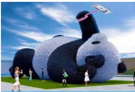
ตุ๊กตาแพนด้าบนเซลฟี

พักที่ MAOXIAN INTER HOTEL โรงแรมระดับ 4 ดาวหรือเทียบเท่าในเมืองเม่าเซียน