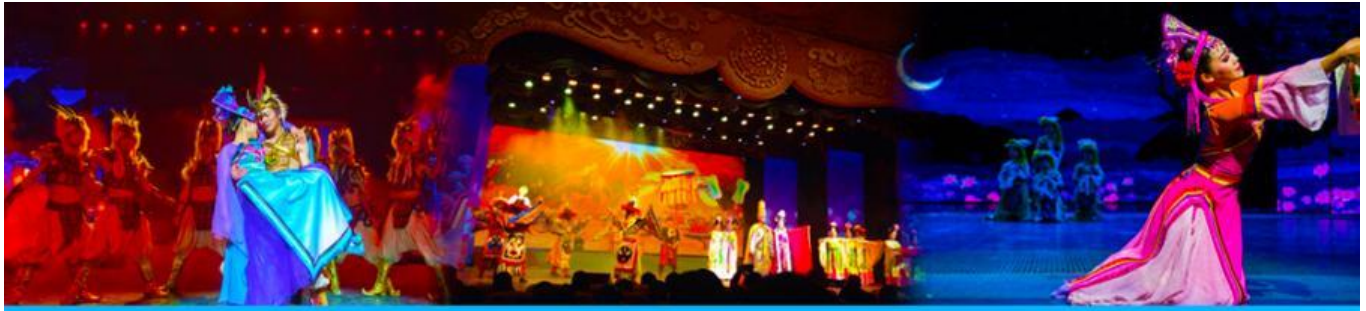
Romantic Show of Jiuzhai

หลังอาหารนำท่านสามารถเลือกซื้อรายการทัวร์เสริม พิเศษการแสดง ชุด Romantic Show of Jiuzhai