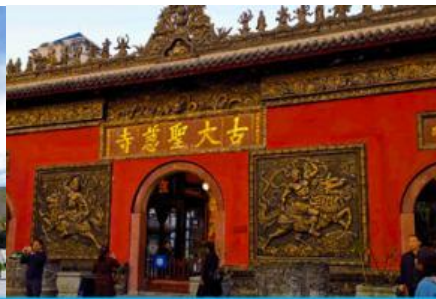
วัดต้าฉือ