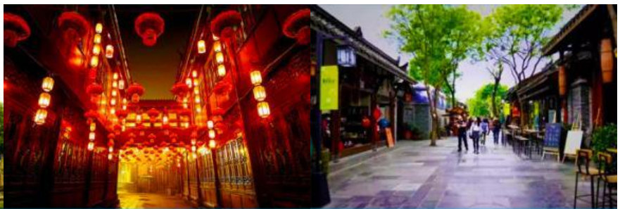
ถนนโบราณสถานจิ้นหลี่