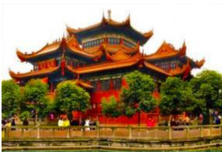
วัดเจาเจี๋ย