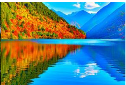
ทะเลสาบแพนด้า