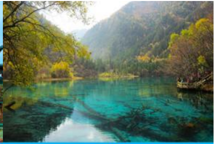
อุทยานจิวจ้ายโกว