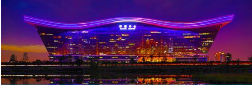
Chengdu new century global center