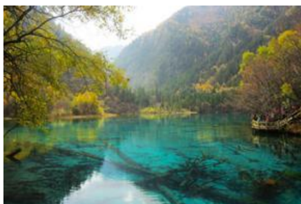
อุทยานจิวจ้ายโกว

พักที่ โรงแรม JIUYUAN HOTEL ระดับ 4 ดาวท้องถิ่นหรือเทียบเท่าในอุทยานจิวจ้ายโกว