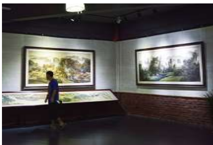
พิพิธภัณฑ์ภาพหินทราย