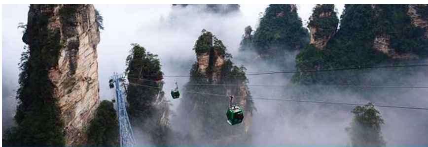
กระเช้าลงจากเขาเทียนจื่อซาน

พักที่ ShanDing PengQuange resort บนเขาผังหยวนเจียเจีย