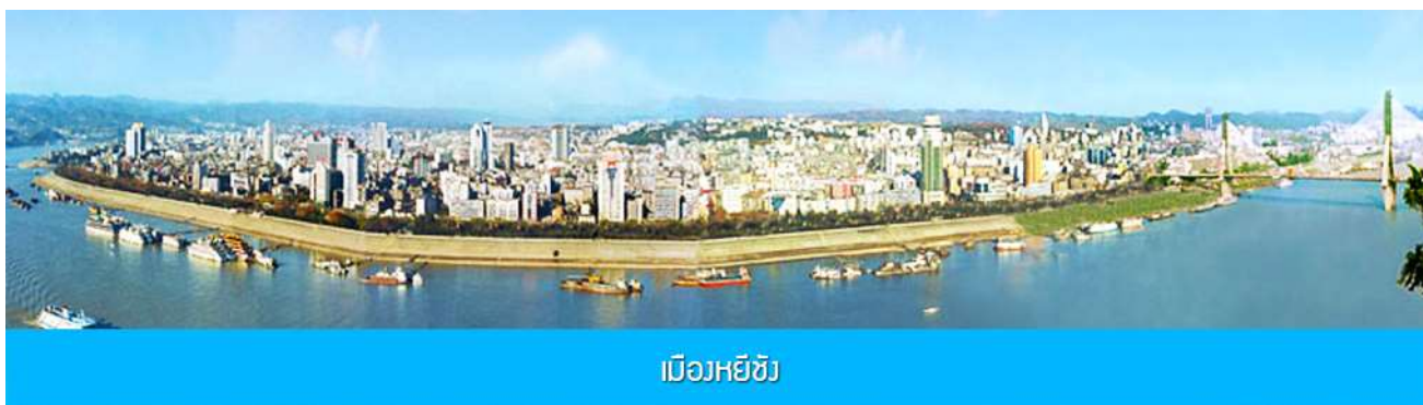
เมืองหยีซาง