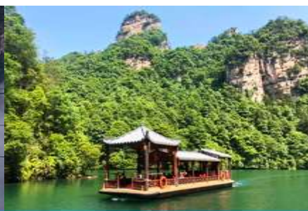
ล่องเรือทะเลสาบ เป่าเฟิงหู

วันที่ห้า ชมพระอาทิตย์ขึ้น-เขาเทียนจื่อซาน(อวตาร) นั่งกระเช้าลงจากเขา-เมืองจางเจียเจีย – เลือกซื้อโปรแกรมทัวร์เสริม ออฟชั่น ทะเลสาบเป่าฟิงหู – เดินทางกลับเมืองหยิงชัง