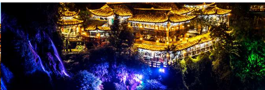
เมืองโบราณฟูหรงเจิ้น