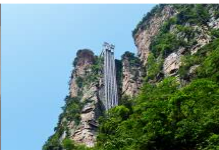
ลิฟท์แก้วไปหลว