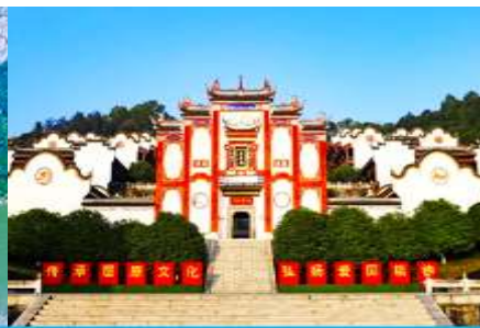
บ้านเกิดกวี ขวี่หยวน