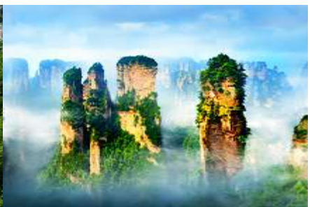
ภูเขาอวตาร