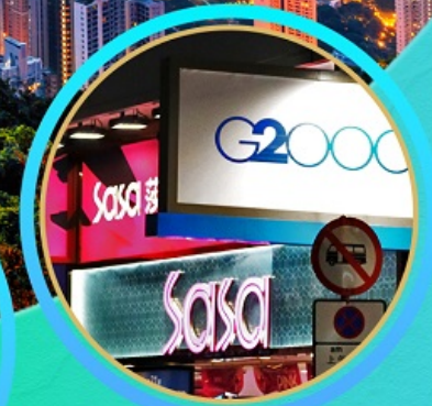
อิสระช้อปปิ้ง