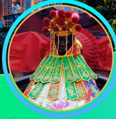
เจ้าแม่กวนอิมสองฮัม