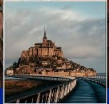
MONT SAINT MICHEL