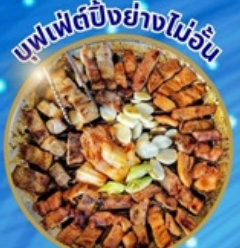
บุฟเฟ่ต์บิงย่างไฉว่ฉั้น