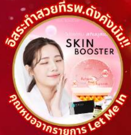
อิสระทำสวยที่พ.ดังคังนัม!! SKIN BOOSTER คุณงามความดี Let Me In

ชมจอ LED ขนาดยักษ์ที่รีสอร์ท 5 ดาว ใหญ่ที่สุดในเอเชียเหนือ ชมพระราชวังคยองบกกุง ย่านฮอนดัตหมู่บ้านบุคซอน ฮันอก ใส่ชุดฮันบก ทำข้าวห่อสาหร่าย อิสระช้อปปิ้ง Lotte Duty Free