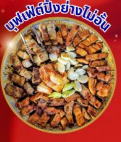
บุฟเฟ่ต์ปิ้งย่างไม่วัน