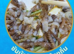
ชั้นนักจ๊อ อาหารท้องถิ่น