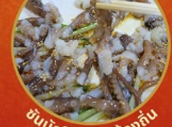
ชั้นนักกีฬา อาหารท้องถิ่น