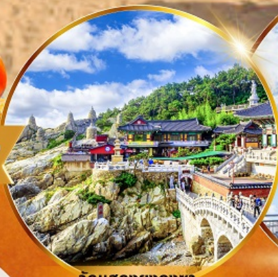
วัดแฮดงยงกุงซา