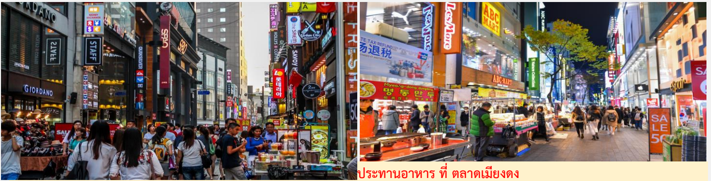
ประธานอาหาร ที่ ตลาดเมียงดง

จากนั้น นำท่านช้อปปิ้ง สินค้าปลอดภาษี ที่ทันสมัยซึ่งมีสินค้าต่างๆ ให้ท่านเลือกมากมายที่ ดิเวตีพีรี อาทิเช่น เครื่องสำอาง เสื้อผ้า กระเป๋าแบรนด์เนม น้ำหอม และอื่นๆ อีกมากมาย นำทุกท่าน ช้อปปิ้งตลาดดง ย่าน MYEONGDONG (เมียงดง) เป็นแหล่งช้อปปิ้งชั้นนำและสถานที่รวมแฟชั่นชั้นนำของกรุงโซล หรือที่คนไทยรู้จักในชื่อของ สยามแสควร์เกาหลี ท่านจะได้พบกับสินค้าวัยรุ่นมากมายหลากหลายยี่ห้อ ไม่ว่าจะเป็นเครื่องสำอางยี่ห้อดังๆอย่าง ETUDE HOUSE, THE SKIN FOOD, THE FACE SHOP, MISSHA ฯลฯ และยังมีสตรีทฟู้ด ร้านอาหารเกาหลีมากมายให้ท่านได้เลือกทานอีกด้วย