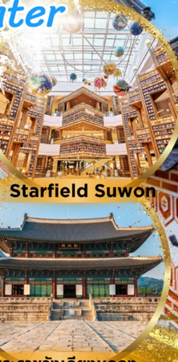
พระราชวังเคียงบกกุง