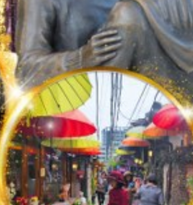
อิกซอนดง