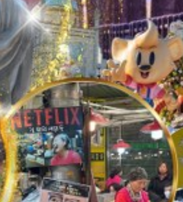
สตรีทฟู้ดตลาดกวางจิ่ง