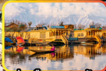
ล่องเรือทะเลสาบคิล