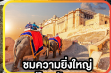
ชมความยิ่งใหญ่ ป้อมอัครา