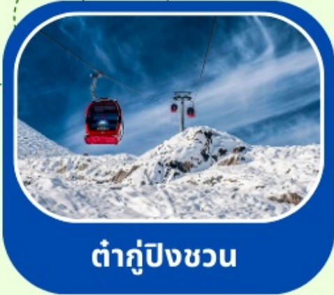
ต่าภูปิงชเวน