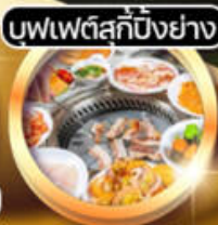
บุฟเฟ่ต์สุกปิ้งย่าง