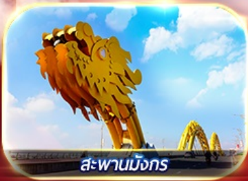
สะพานมังกร