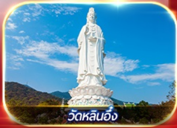
วัดหลินอึ้ง