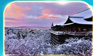
วัดคิโยมิสึ