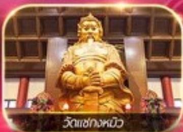
วัดเขากงหมิว