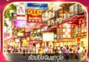
ซุปปิ้งจีนชาฮุย

เต็มอิ่มทั้ง ไหว้พระ-ขอพร และ ซุปปิ้งแบบจัดเต็ม