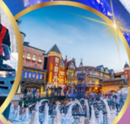
โรงงานช็อคโกแลต ชิโรอิ โคอิมีโตะ

ราคาเริ่มต้น 36,919 บาท รวมภาษีมูลค่าเพิ่ม 7%