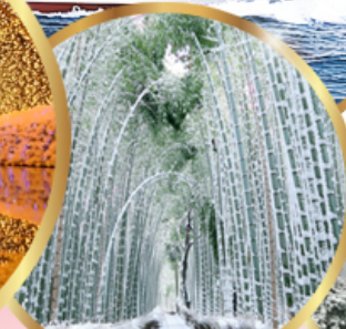
ป่าไฟ อาราชิมายา