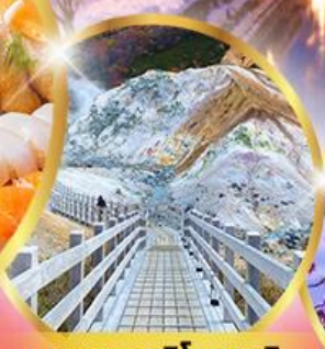
หุบเขานรกจิทอกุตามิ