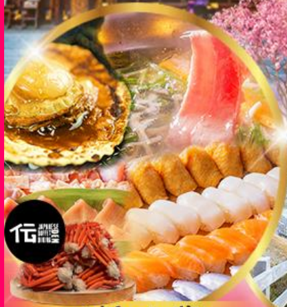
บุฟเฟ่ต์ซาปู + ซีฟุด อาหาร มากกว่า 50 เมนู